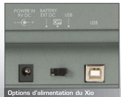
Options d'alimentation du Xio

Quand l'unité est reliée à l'ordinateur, l'interrupteur situé à l'arrière doit être positionné comme représenté :